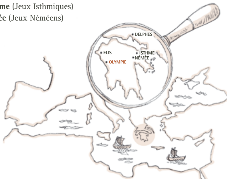
CARTE DU BASSIN MÉDITERRANÉEN : LA GRÈCE ET LES SITES DES JEUX PANHELLÉNIQUES

Les Jeux Panhelléniques avaient la particularité de rassembler le monde grec (pan = tout, hellène = grec) à une époque où la Grèce n'était pas encore un État mais était formée de cités-états (communautés politiquement et économiquement indépendantes). De la Grèce et de ses colonies (Italie, Afrique du Nord et Asie Mineure), les gens se déplaçaient pour participer ou assister aux Jeux, animés par un sentiment commun : leur appartenance à une même culture et à une même religion.