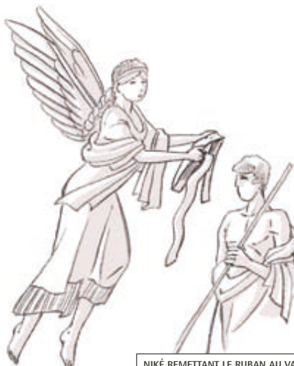
NIKÉ REMETTANT LE RUBAN AU VAINQUEUR

Les Grecs de l'Antiquité pensaient que c'était les dieux qui décidaient d'accorder la victoire à un athlète. Ils représentaient la victoire sous la forme d'un personnage féminin ailé, appelé Niké , ce qui signifie « victoire » en grec. Servante ou messagère des dieux, Niké s'envolait dans les airs et apportait à l'heureux élu la récompense divine sous forme de couronne ou de ruban.