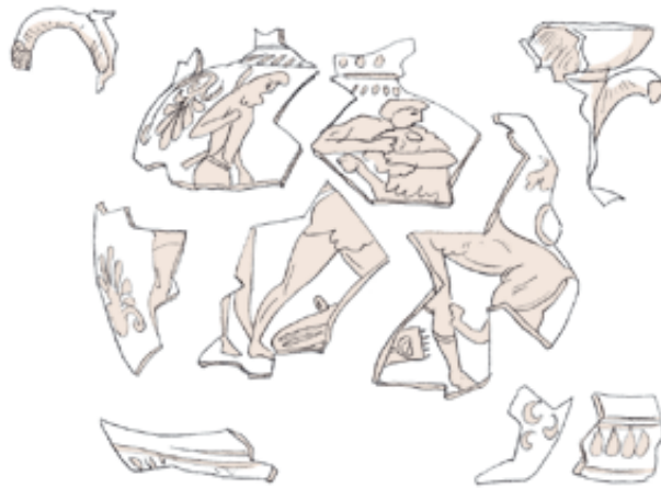
SCÈNE MONTRANT HÉRACLÈS EN TRAIN DE TUER LE LION DE NÉMÉE. HÉRACLÈS (HERCULE EN ROMAIN) ÉTAIT CONSIDÉRÉ COMME L'ATHLÈTE IDÉAL

Devant une sculpture ou dans une scène peinte sur un vase, on peut facilement reconnaître un athlète à sa nudité . En effet, pour l'entraînement et les compétitions, les athlètes étaient toujours nus car ils devaient refléter l'idéal d'un équilibre harmonieux entre le corps et l'esprit. Selon cet idéal, seul celui qui entraînait son corps pouvait développer son esprit. On retrouve cette idée à l'époque romaine ( mens sana in corpore sano ).