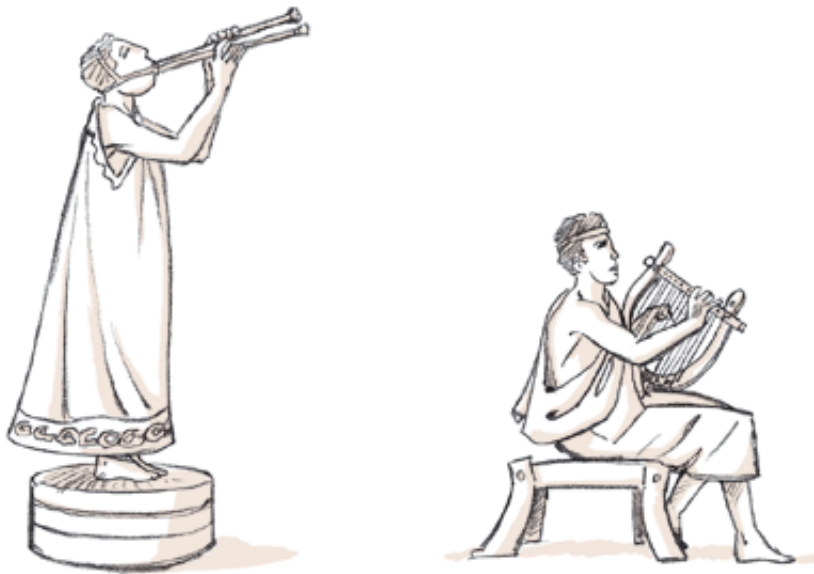
UN JOUEUR DE DOUBLE FLÛTE / UN JOUEUR DE CITHARE

Bien avant l'apparition des concours sportifs, des concours musicaux étaient organisés à Delphes. Il s'agissait de chants accompagnés à la cithare (sorte de lyre), de solos de flûte ou encore de chants accompagnés par la flûte. Musique et chant continuèrent d'être au programme même après l'intégration des concours sportifs. Il y avait même des concours de poésie et de théâtre.